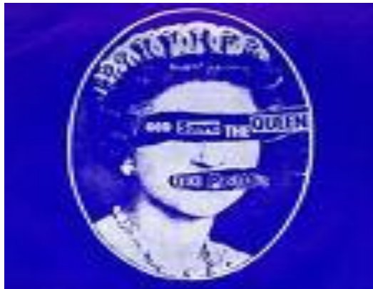
Figura 1 The Sex Pistols ‘God Save the Queen!’

una segunda pregunta más fundamental. ¿Estamos de acuerdo con que ‘to choose’, ‘escoger’, es el bien humano principal? ¿Es la autonomía propia el bien principal o puede ser que hacer elecciones libres, propias, es algo que Mill predica de seres entendidos como agentes racionales? Es decir, es posible que el argumento liberal se apoye en la premisa de que somos seres racionales, pero también es posible que tales seres sólo emerjan en una sociedad que, a través de la restricción de elecciones, nos moldee como agentes morales. Así, por ejemplo, al enseñar a nuestros hijos a no comer un paquete entero de galletas de chocolate, les enseñamos lo que es ser una persona que piensa en los demás, que les tiene en cuenta. En efecto, es posible que el tipo de carácter aprobado por Mill – alguien que busca la verdad, que es independiente y que no es aplastado por la mediocridad colectiva – no se fomente en un clima donde uno considera la autonomía propia como el bien principal.