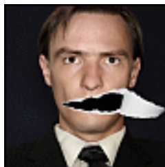
Figura 4 'Herejes nuevos'

La herejía siempre se define en oposición a la ortodoxia imperante. Las ortodoxias de hoy pueden convertirse en las herejías de mañana. Un comentarista británico, crítico de esta tendencia en la cultura contemporánea, mantiene que es el destino del cristianismo en la sociedad occidental actual. Y añade: 'Lo que especialmente me molesta, viejo marxista como soy, es el papel líder desempeñado por el