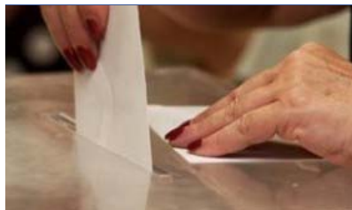
Consultas independentistas en 71 ayuntamientos de Cataluña