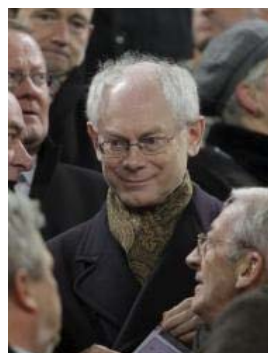
El presidente del Consejo Europeo, Herman Van Rompuy.

La FUNCIVA es una fundación impulsada por los ex diputados Andrés Ollero (PP) y Francisco Javier Paniagua (PSOE) y formada por profesionales de diferentes áreas y planteamientos ideológicos.